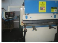
Bükme ve Kıvrma Makinası