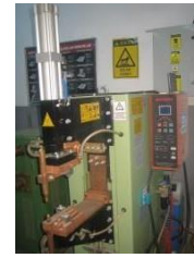
Elektronik Punta Kaynak