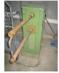
Mekanik Punta Kaynak